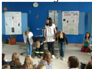
DBG-Schülergruppe nach Aufführung ihres Showteils

Sehr gut angekommen ist der Kelly-Insel-Projekttag "Rund um Handy & Internet" am 5. Mai 2009 am Dietrich-Bonhoeffer-Gymnasium in Filderstadt-Sielmingen. Es war beeindruckend zu sehen, wie sich die Schüler mit dem Thema befasst hatten. Viele Helfer trugen zu dieser gelungenen Veranstaltung bei. Selbst der abschließende Elternabend war gut besucht. (weitere Infos auf unserer Homepage)