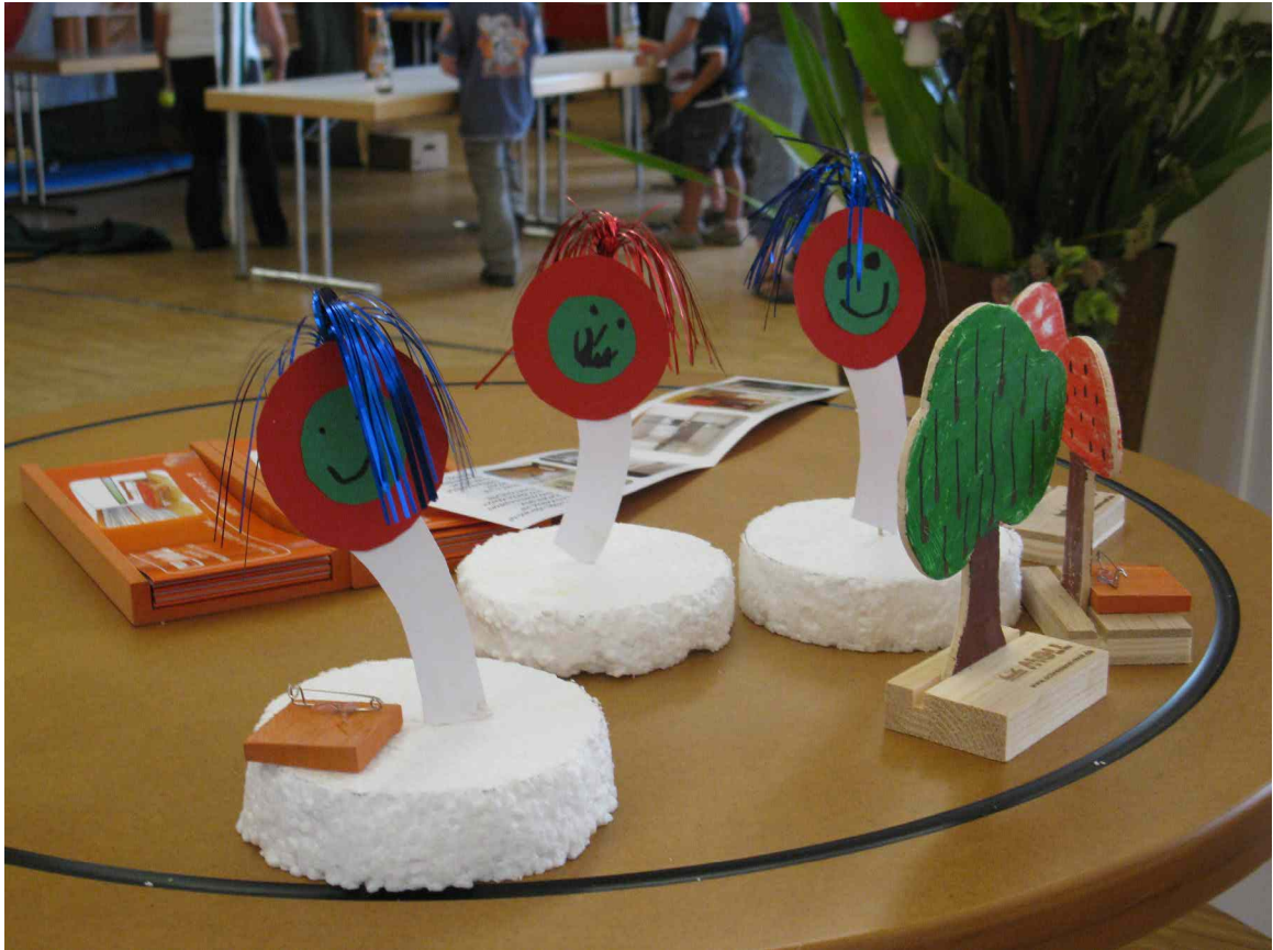
Es gab viele Kreativangebote und Informationen.